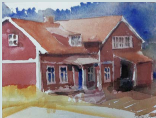
Runmarö Hembygdsgränd, akvarell av Elsa Grip

Mycket händer en vanlig sommar på ön: Runmaröspelet med Runmarö teatergrupp, Runmarö Musik- och Litteraturdagar, musik- och standupkvällar på Svängen, Strindbergsvandringar, och Hembygdsföreningens byvandringar, biokvällar och Runmarödagen med loppis. Olika arrangörer står för tennis, motionslopp, fotboll, segelskola och -tävling och kurser i ståpaddling, konstskapande, örtmedicin med mera. Föreningen Fårskallarnas får och lamm håller ängsmarkerna öppna. I två Facebookgrupper köper, säljer, byter och skänker man prylar till varandra (2.300 medlemmar!) och har nyhets- och tankeutbyte.